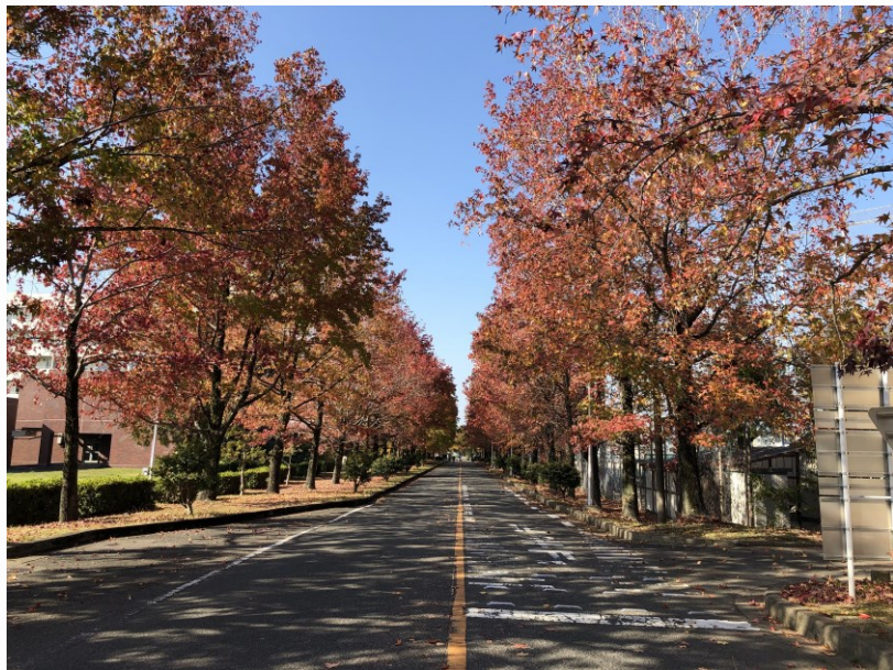
筑紫校區的楓葉林