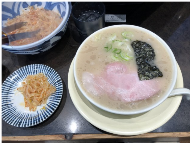
宿舍附近的きりん拉麵 太好吃了所以每個禮拜都去吃

宿舍: 我住的宿舍是在冷泉公園旁邊的福岡市國際會館，一個月的租金含水電約臺幣6500元，住在這裡的好處就是離博多和天神車站非常近，而且附近就是博多運河城，還有博多傳統工藝館、櫛田神社等知名地標，食衣住行育樂都非常便利。