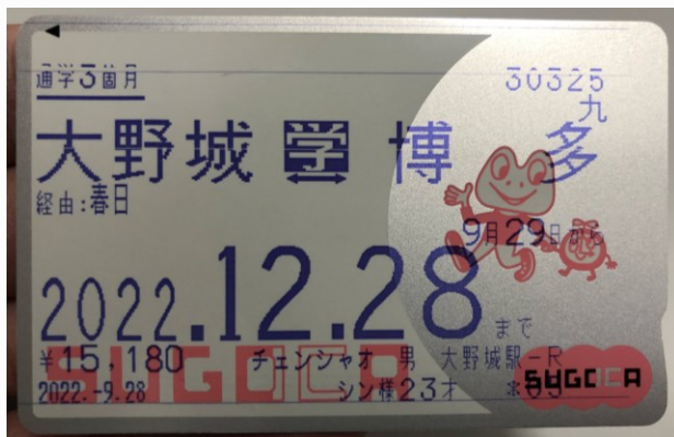
JR鐵路的三個月月票

還有一個我覺得很好的一點是福岡機場離市區非常近，因此如果計畫要四處旅行的話來福岡也是一個不錯的選擇。