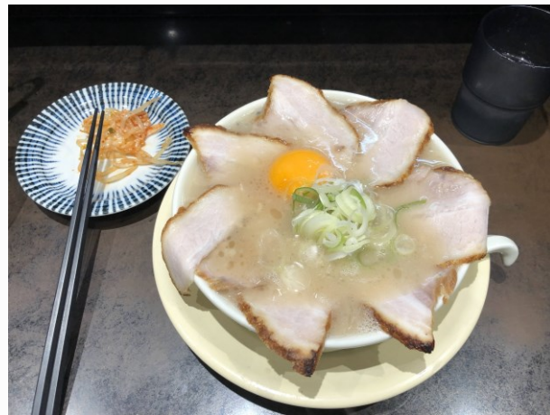
11月的每日限量拉麵